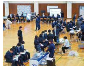
【昨年度実施時の様子↑】

※申込状況や同業種が多かった場合や生徒の希望調査等により参加のご希望に沿えない事がございます。予めご了承下さい。