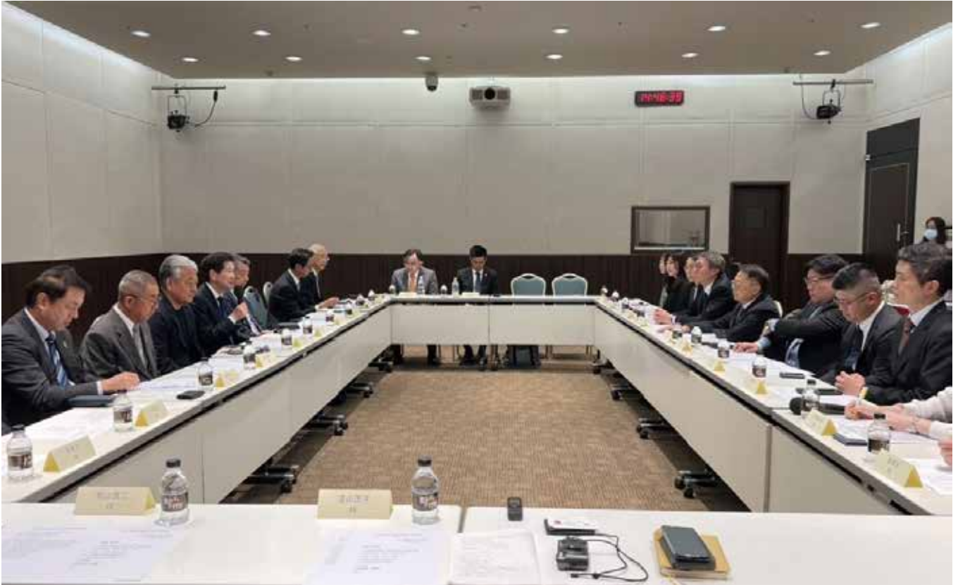
台湾の経済団体 台日商務交流協進会との意見交換会

去る10月9日から12日にかけて、台湾台北の視察研修会を実施いたしました。今回は、台湾の経済団体である台日商務交流協進会との意見交換会を実施してまいりました。現在の日本と台湾は、ビジネスから外交、国家の政策にいたるまで、広範囲に友好な関係が育まれています。日本、台湾双方の企業にとっても、ビジネスパートナーとしてお互いなくてはならない存在でもあります。歴史の中で、今から約30年前の1992年（平成4年）に、「台日商務交流協進会」の前身である「台日商務協議会」が誕生しました。ここで改めて、台湾の状況を見ますと1980年以降、産業構造が大きく変化して、一般的な製造業からハイテク産業へと転換、また新竹にサイエンスパークを設置し、産業はITを含む電機・電子・半導体分野への傾斜が強めるなど、高度な情報技術を活用した産業に注力するようになります。そして、1990年代には、電子産業を軸に科学技術方面での工業を中心とした経済を築き上げ、アジアNIEsの一角を担うまでに成長しています。一方で日本は、バブル崩壊を経験し、勢いを失った経済ではありましたが、それでも日本企業が持つ世界でもトップクラスの先端技術は台湾企業にとって非常に魅力的なもので、日本企業からの技術導入、また日本企業の製品をOEM生産したいと望む台湾企業は非常に多いものでした。このような台湾産業界からの要望を受け、日本と台湾のビジネス交流を強化し、長期的でかつ安定した経済・貿易関係を築くためのプラットフォームとし