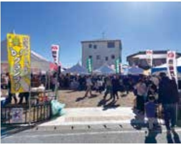
※写真は昨年度のものになります。

今年では会場を変更し明神通り・妙経寺にて実施。ステーションや屋台などお楽しみも盛りだくさん! 装いも新たな姉崎門前市にご期待下さい!!