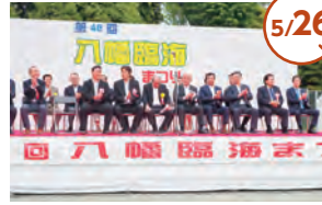
第48回八幡臨海まつり