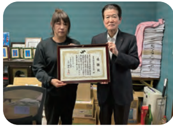
▲ 泉水建材(株) 震災でも、義援金による復興支援が行われま