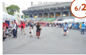
第45回五井臨海まつり