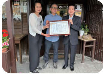
▲ (株)市原テクレックス