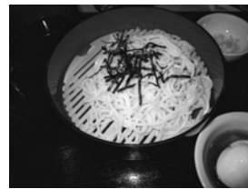
米粉うどん(八幡屋商店)

百円で市原商工会議所が販売を取り次ぐ。のぼり旗の収益は、市原の米粉PR費用に充当していく予定である。市原市の農業は、県内でも有数の産出額である。中でも米については「養老