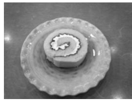
米粉ロールケーキ(松月堂本店)