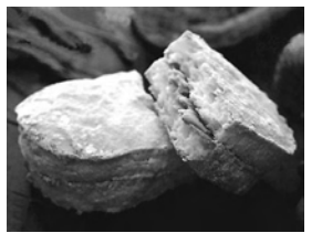
米粉ダックワーズ(梅香堂)

ら、市原市の食のブランド化を推進していくことが狙いである。米粉は、小麦粉の替わりに使われ、その独特のモチモチ感と小麦粉アレルギーの人もケイキヤパン、うどんなど、アレルギー